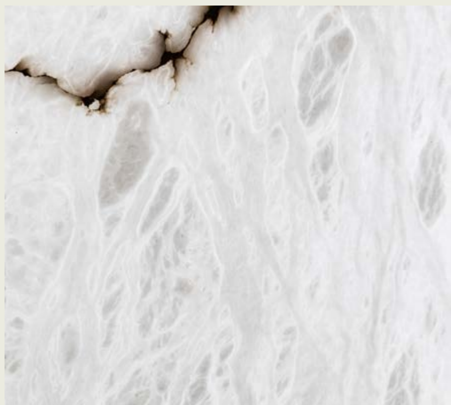
EBRO Reconocido por su translucidez lechosa y su veteado en tonos tierra y grisáceos.

Seleccionamos la veta adecuada para cada proyecto.