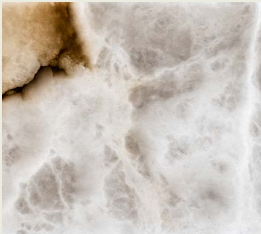
ZAIDA Destaca por su translucidez excepcional en blanco nieve, con vetas en tonos tierra rojizos y sutiles texturas nubosas.

En la actualidad, comercializamos 2 modelos de alabastro: