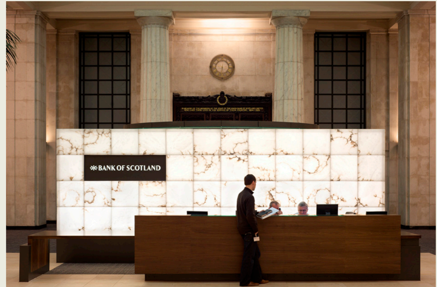
Banco de Escocia